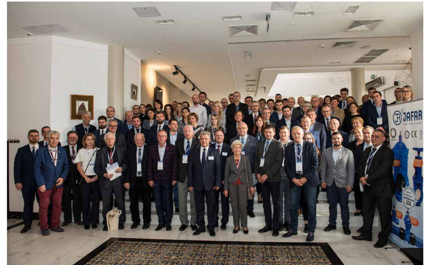
Zdjęcie pamiątkowe uczestników konferencji.