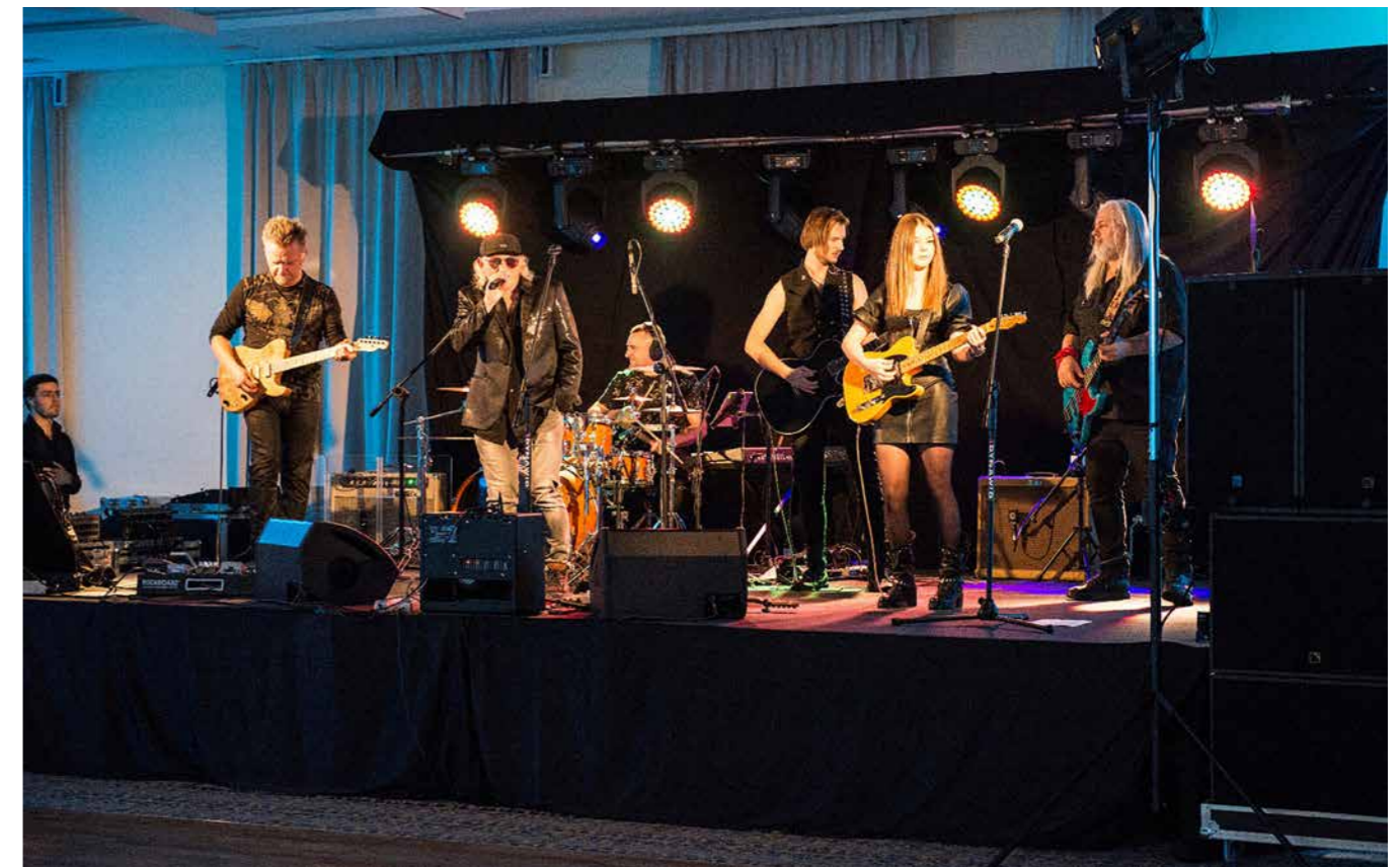
Występ zespołu „Chłopcy z Placu Broni” podczas Kolacji Galowej konferencji.