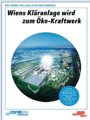
Okładka Deklaracji Środowiskowej EMAS spółki Ebswien.