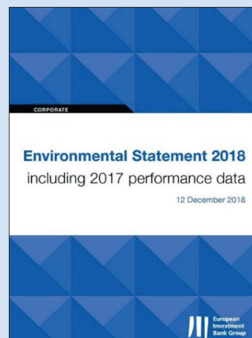
Okładka Deklaracji Środowiskowej EMAS EBI.