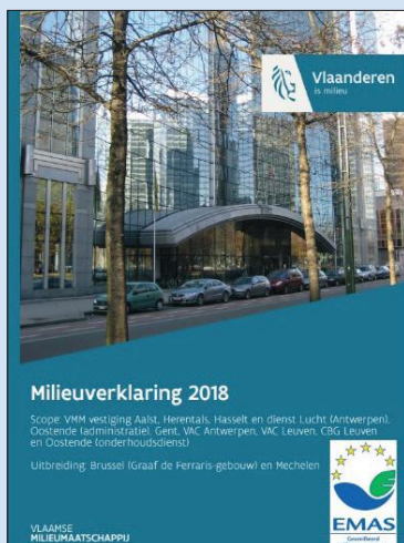
Okładka Deklaracji Środowiskowej EMAS Flamandzkiej Agencji ds. Środowiska.