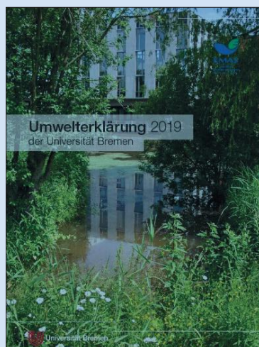
Okładka Deklaracji Środowiskowej EMAS EBI.

przedstawia dogłębną analizę systemów energii, mobilności i żywności. Wskazuje również szeroki zakres rozwiązań i innowacji, wraz z określeniem ich wpływu na środowisko przyrodnicze. Przybliża również potencjalne „dźwignie” czyli środki, innowacje lub trendy, które mogą wspierać i przyspieszać pożądane rozwiązania. Odkrycia i spostrzeżenia zawarte w tym raporcie mogą służyć jako naukowe źródło inspiracji dla decydentów i wszystkich podmiotów społecznych, które chcą pomóc w kształtowaniu przejścia do tzw. zrównoważonego społeczeństwa.