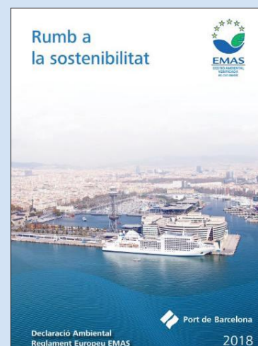
Okładka Deklaracji Środowiskowej EMAS Portu w Barcelonie.