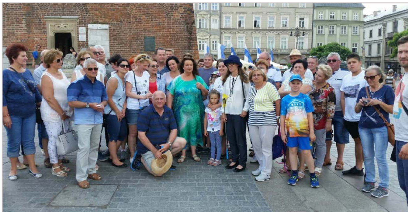
Uczestnicy wycieczki z aktorką Anną Dymną