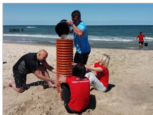
Nie zabrakło dziwnych konkurencji