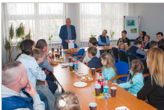
Dzieci pracowników na podsumowaniu konkursu