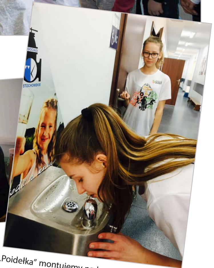
„Poidelka” montujemy na korytarzach, przy stołówkach lub salach gimnastycznych