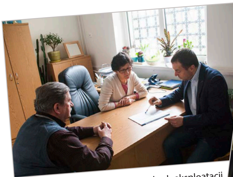
Nasi pracownicy informują o warunkach eksploatacji „poidelka”