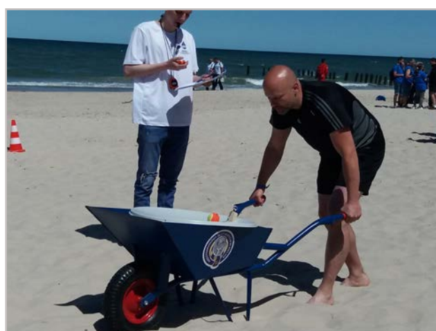
J jeszcze dziwniejszych...