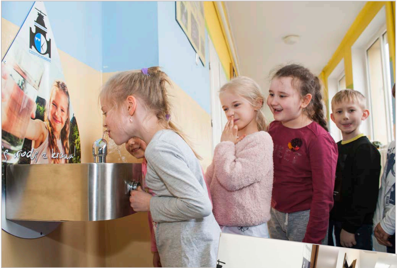
Dzieci chętnie piją kranówkę