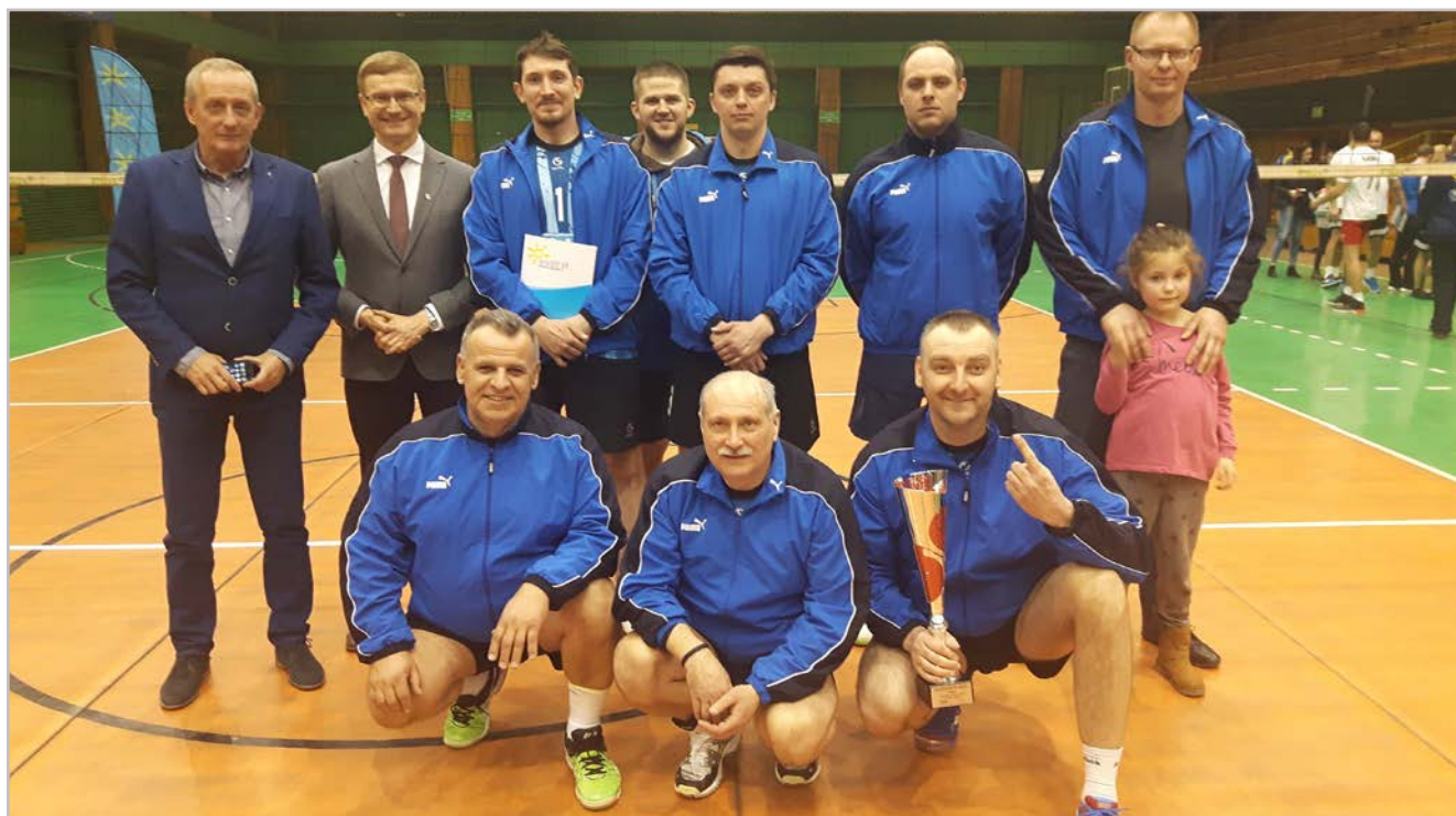
Nasza drużyna z Prezesem i z Prezydentem