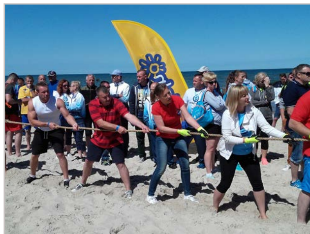
Przeciąganie liny - klasyka