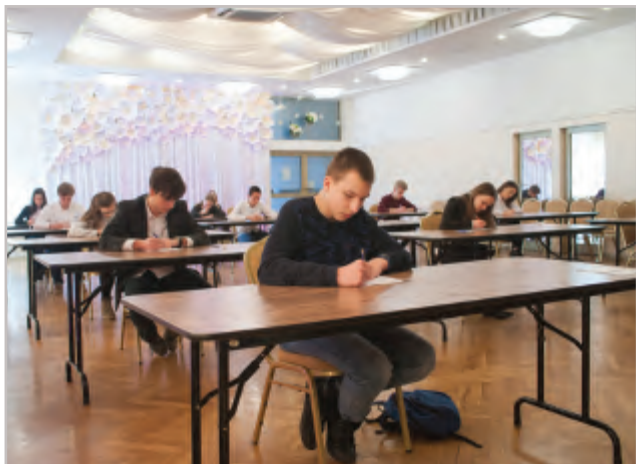
Uczestnicy mieli 60 minut czasu na pisanie sprawdzianu konkursowego