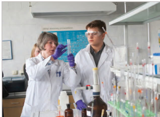
Podczas oczekiwania na wyniki, uczniów gościło nasze laboratorium