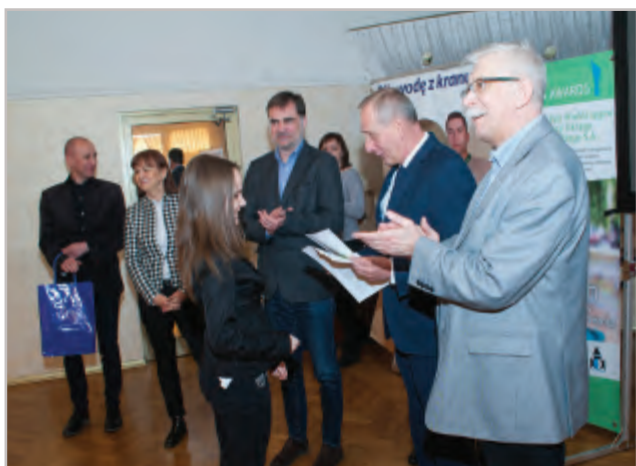
Rozdanie nagród i gratulacje gimnazjalistom