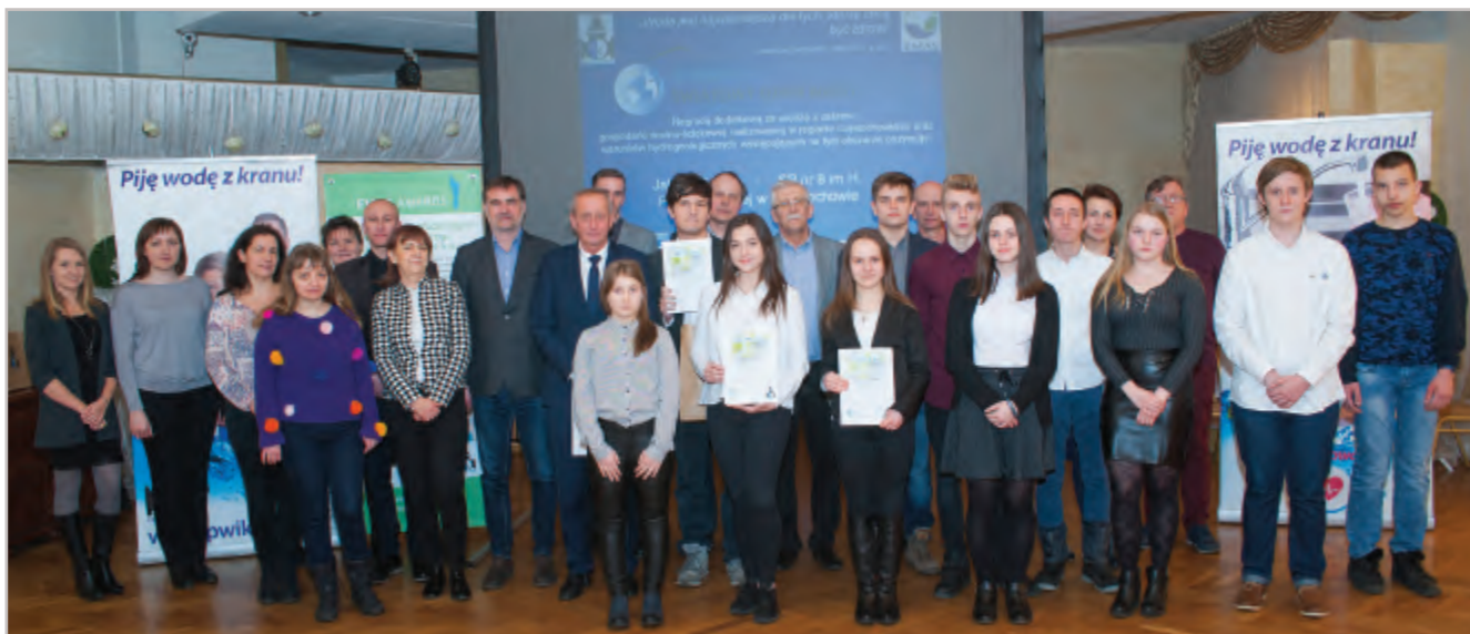
Wszyscy uczestnicy konkursu wraz z nauczycielami i organizatorami