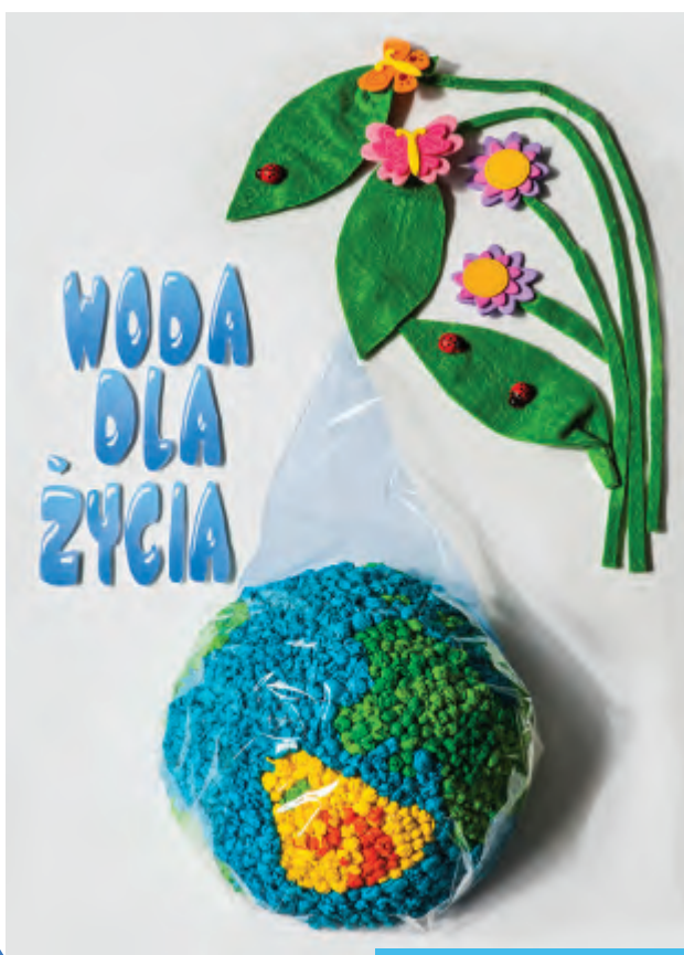
autor: Patrycja Leśnikowska