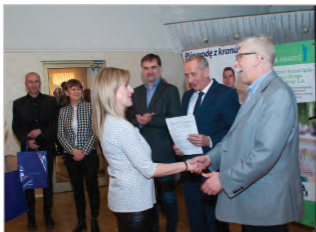
Dyplomy z podziękowaniami otrzymali także nauczyciele