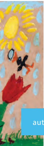
autor: Bartosz Gmur