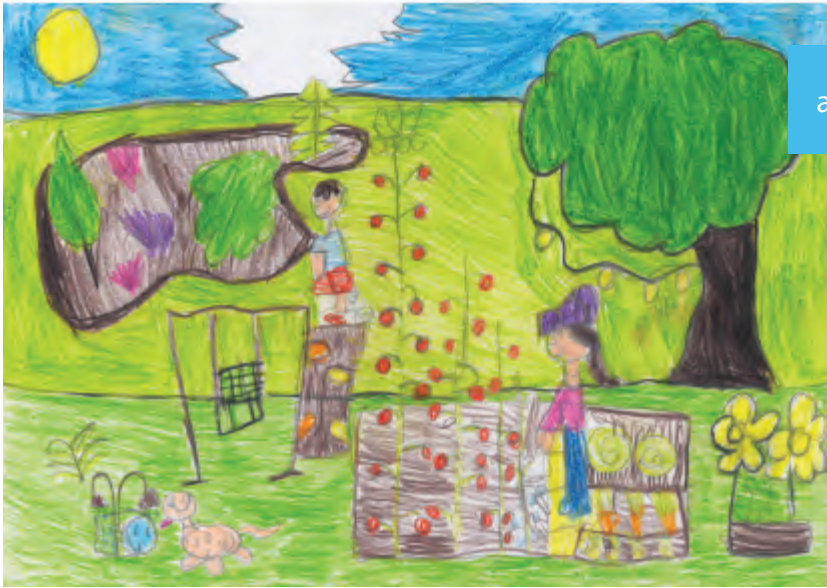
autor: Zuzanna Soluch